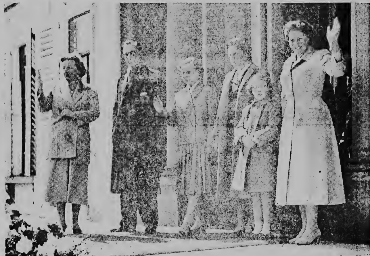
Nos familia real feliz riba e bordes di palacio Soestdijk durante un homenaje door di e poblacion. Di drecbi pa robes nos por mira e prinsenan Beatrix, Marijke, Irene, Margriet, Prins Bernhard y Reina Juliana.